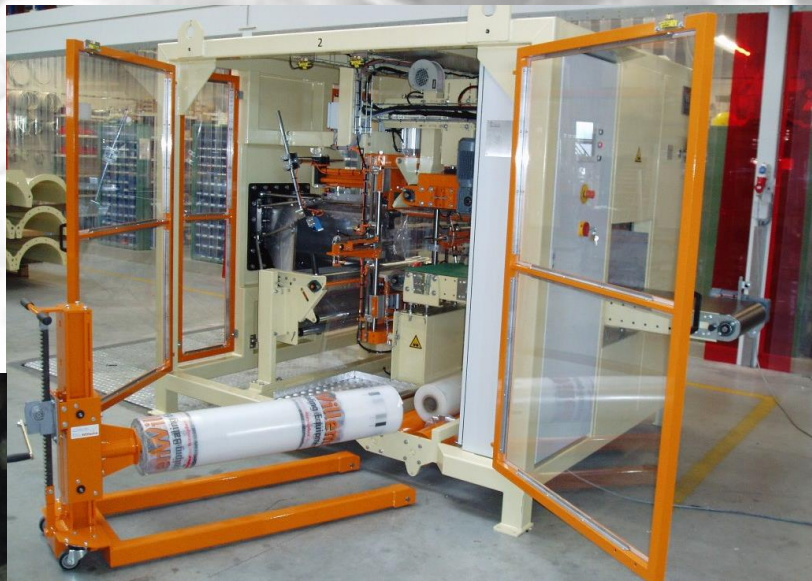
Flat foil packaging machine