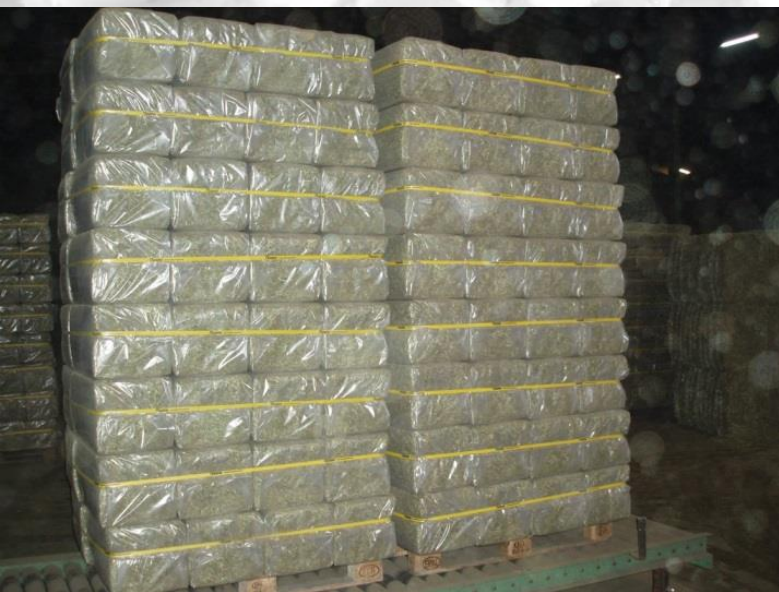
Packaging out of flat foil