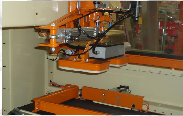
Vacuum stacking unit.