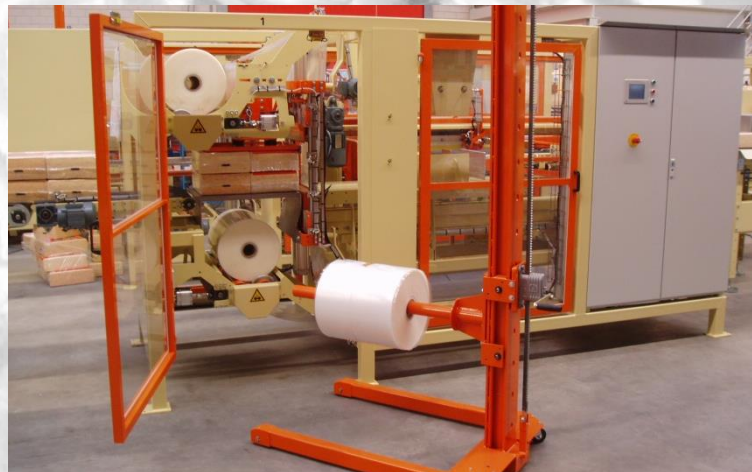
Packaging made out of stretch foil on a roll